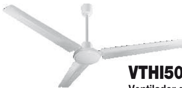
VTHI503 Ventilador de Techo Industrial color blanco con palas de metal

Si necesita cambiar la luminaria (módulo led), su reemplazo debe realizarse por persona idónea. El plafón se extrae retirando los 3 tornillos equidistantes más pequeños que se encuentran en la parte superior del equipo, uno de los cuales se encuentra debajo de una de las palas. Por lo tanto, esta pala debe retirarse totalmente antes de cambiar la luminaria.