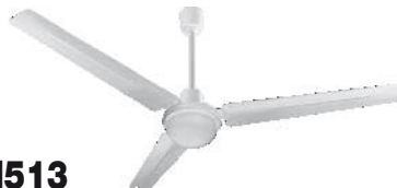
VTHI513 Ventilador de Techo Industrial color blanco con palas de metal y luminaria