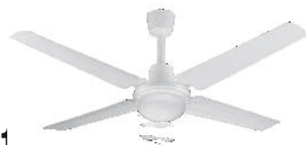
VTHB11 Ventilador de Techo color blanco con palas de metal y luminaria