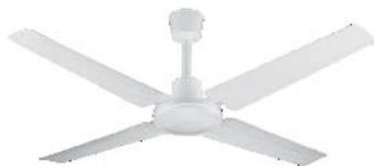
VTHB104 Ventilador de Techo color blanco con palas de metal

Si necesita cambiar la luminaria (módulo led), su reemplazo debe realizarse por persona idónea. El plafón se extrae retirando los 3 tornillos equidistantes más pequeños que se encuentran en la parte superior del equipo, uno de los cuales se encuentra debajo de una de las palas. Por lo tanto, esta pala debe retirarse totalmente antes de cambiar la luminaria.