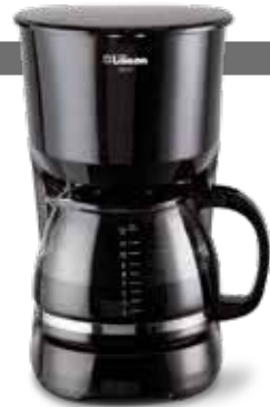
Imágenes de carácter ilustrativo

Antes de usar su cafetera eléctrica por primera vez, o si la misma estuvo sin uso por un largo periodo, siga las instrucciones del apartado anterior "Antes de usar por primera vez"