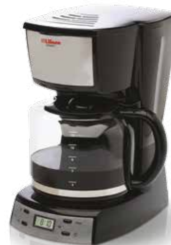
CAFETERA ELÉCTRICA CON DISPLAY DIGITAL