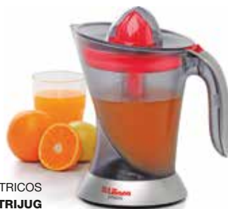
EXPRIMIDOR DE CÍTRICOS CITRIJUG

Asegúrese de la correcta limpieza y esterilización de todos los componentes.