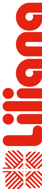
Imagen solo de carácter ilustrativo

Modelo: Art. AE920 EXPRIMIDOR DE CÍTRICOS CITRIJUG