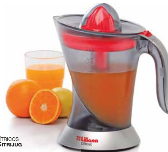
EXPRIMIDOR DE CÍTRICOS CITRIJUG