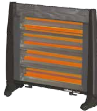
Alimentación: 220-240 V ~ 50-60 Hz Potencia: 1200/2400 W