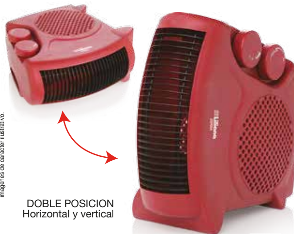
DOBLE POSICION Horizontal y vertical