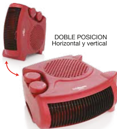
DOBLE POSICION Horizontal y vertical

Alimentación: 220-240 V ~ 50-60 Hz Potencia: 1000/2000 W