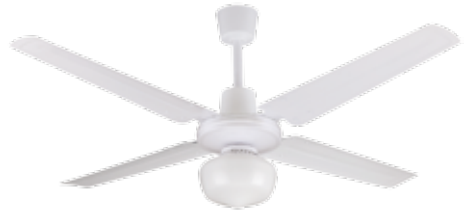
VTHB110 Ventilador de Techo color Blanco con palas de metal y luminaria.

Nunca exponga al agua el cuerpo motor, ni tampoco la caja comando de velocidades.