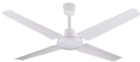
VTHB100 Ventilador de Techo color Blanco con palas de metal

Nunca exponga al agua el cuerpo motor, ni tampoco la caja comando de velocidades.