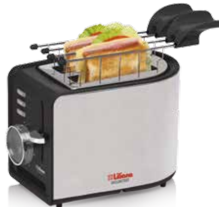
Imágenes solo de carácter ilustrativo

Este aparato no está pensado para ser usado por personas (incluidos niños) con capacidades físicas y mentales reducidas, que no posean experiencia en el